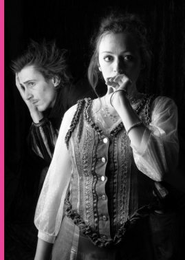
Chlaina d'Organdates